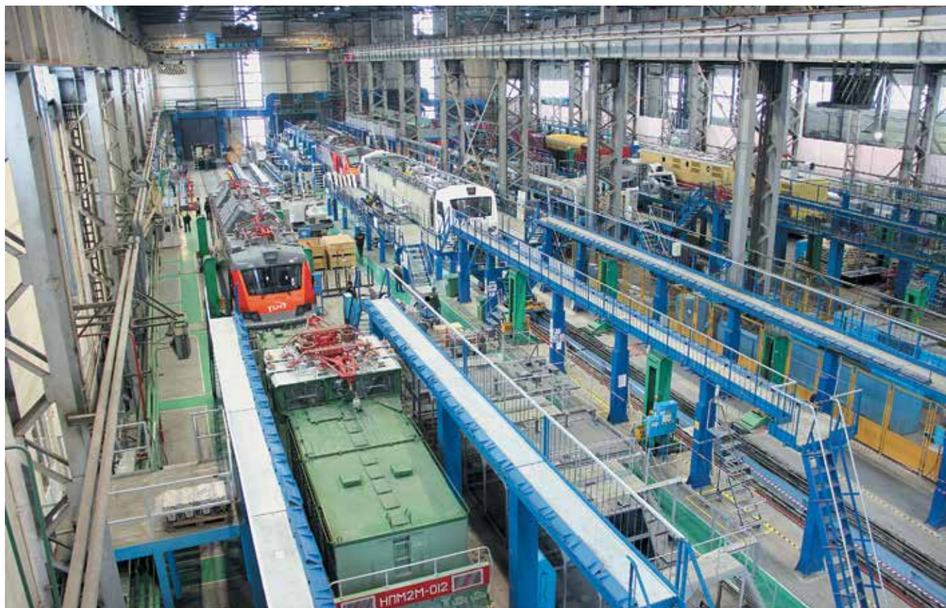
Эталонные линии сборки электровозов, НЭВЗ

ОРГАНИЗАЦИЯ ЦЕНТРОВ КОМПЕТЕНЦИЙ СОЗДАСТ КОЛОССАЛЬНЫЙ ЭКОНОМИЧЕСКИЙ ЭФФЕКТ