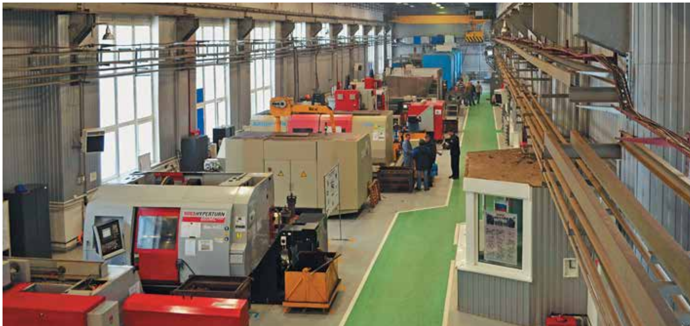
Участок станков с ЧПУ для механической обработки деталей, ДМЗ

рамках был создан участок изготовления шестерен тяговых редукторов, полностью выстроены технологические линии производства. Планируется, что к 2018 году он будет изготавливать локомотивные тележки для всех предприятий холдинга. Также перед Брянским машиностроительным заводом стоит довольно амбициозная задача выпуска магистральных локомотивов 2ТЭ25КМ. Уже на следующий год планируется производство 200 секций локомотивов,