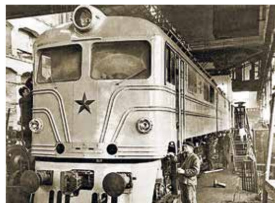
Электровоз Н8 № 001 в сборочном цехе НЭВЗа