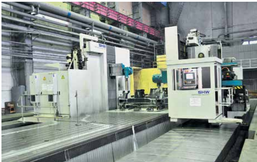
Обрабатывающий центр для обработки главной рамы магистрального тепловоза, БМЗ

Одновременно мы повышаем эффективность организации производства. Например, возьмем процесс