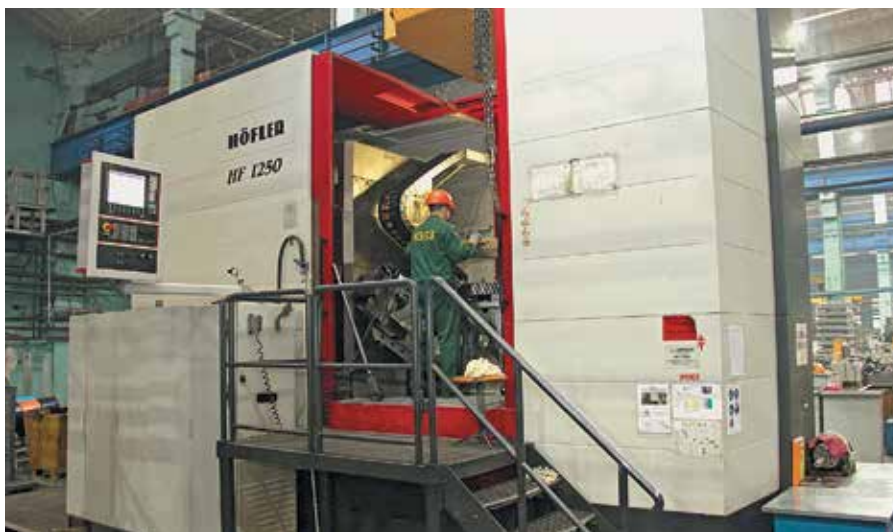
Участок изготовления шестерен, НЭВЗ

ЧТОБЫ СВЕСТИ К МИНИМУМУ ЗАВИСИМОСТЬ ОТ ВОЗМОЖНЫХ ПРОБЛЕМ С ПОСТАВКАМИ КОМПЛЕКТУЮЩИХ ИЗ-ЗА РУБЕЖА, В ХОЛДИНГЕ ПРИНЯТО РЕШЕНИЕ О ТОМ, ЧТО ВСЕ КЛЮЧЕВЫЕ ЭЛЕМЕНТЫ ПОДВИЖНОГО СОСТАВА МЫ ПРОИЗВОДИМ САМИ