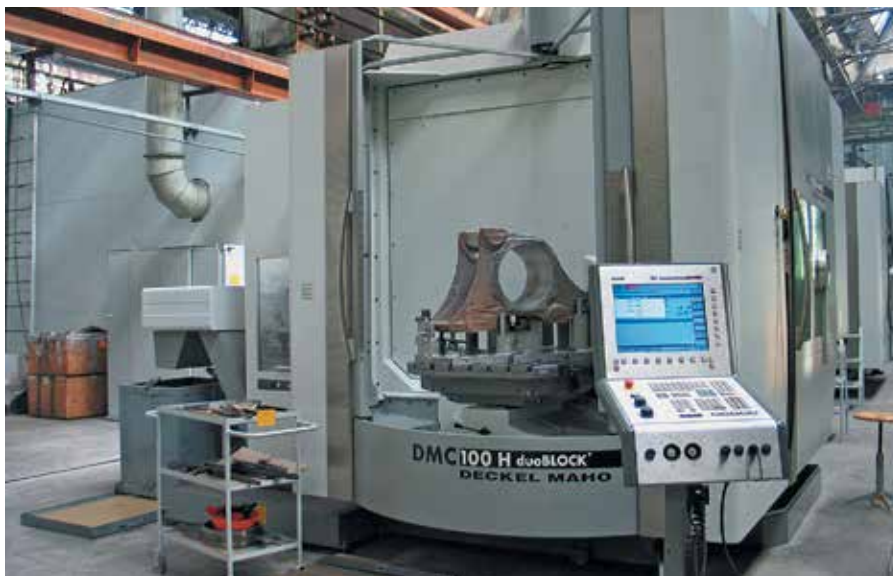
Участок изготовления букс, НЭВЗ

— Первым делом мы определяем специализацию производственных площадок холдинга для развития на них сборочных производств однородной продукции с высокой степенью технологической унификации. А уже на базе