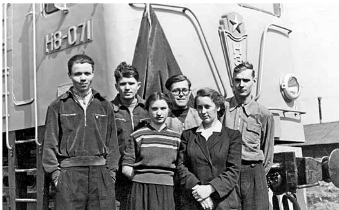
Специалисты НЭВЗа на испытаниях электровоза Н8