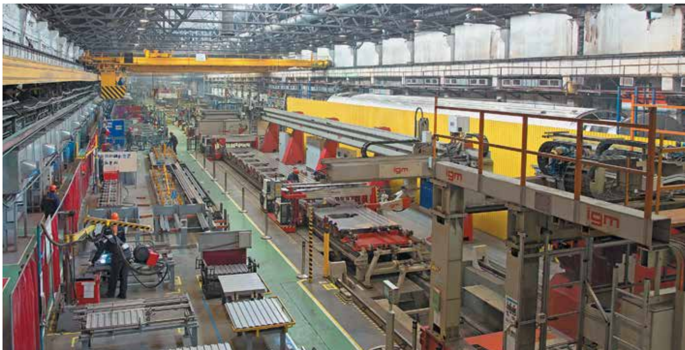
Участок изготовления боковых стен вагонов, ТВЗ

При модульной конструкции на 30% сокращаются сроки создания новых моделей и себестоимость изготовления продукции, также на 30% снижается